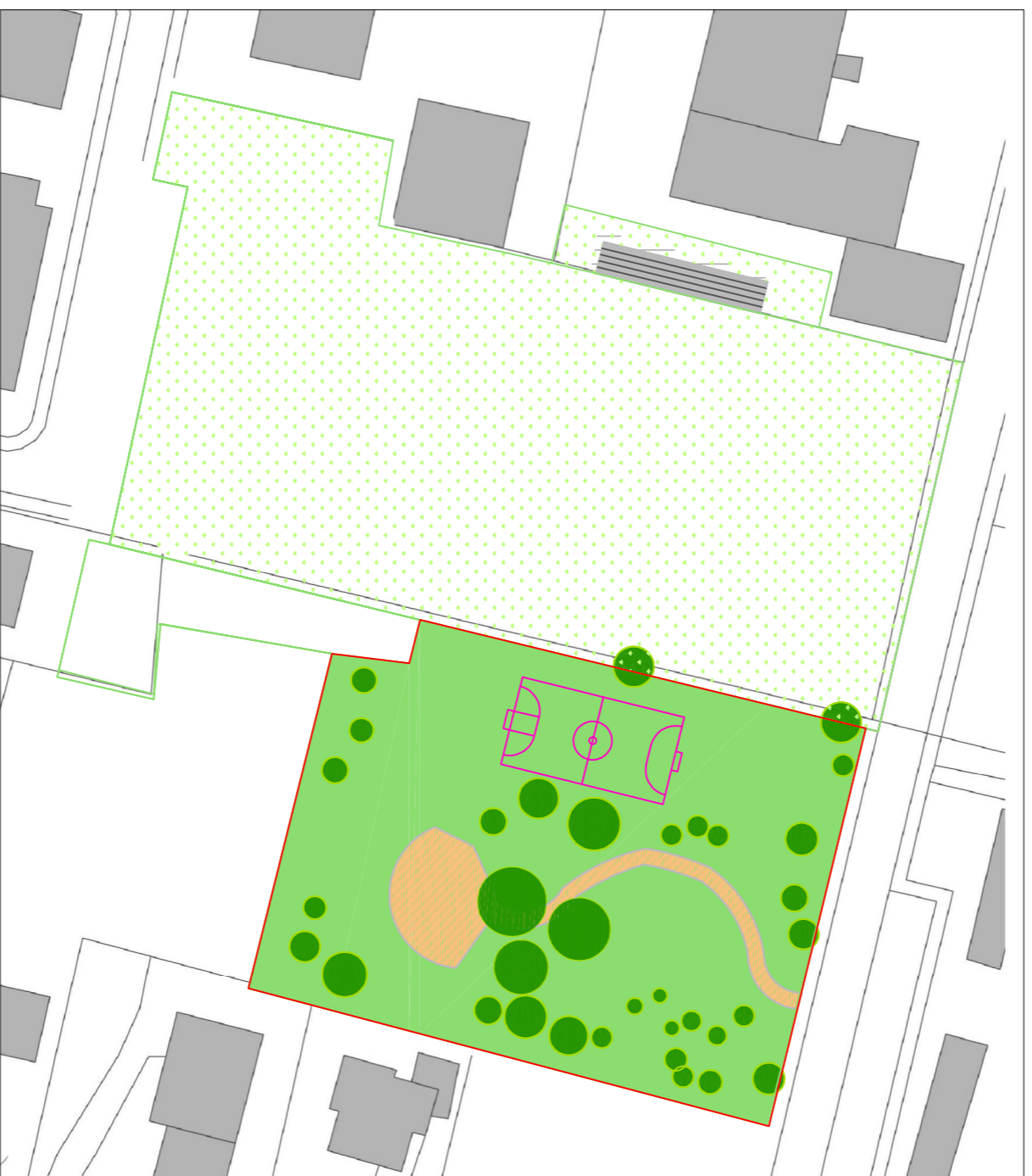
STATO DI FATTO scala 1:1.000